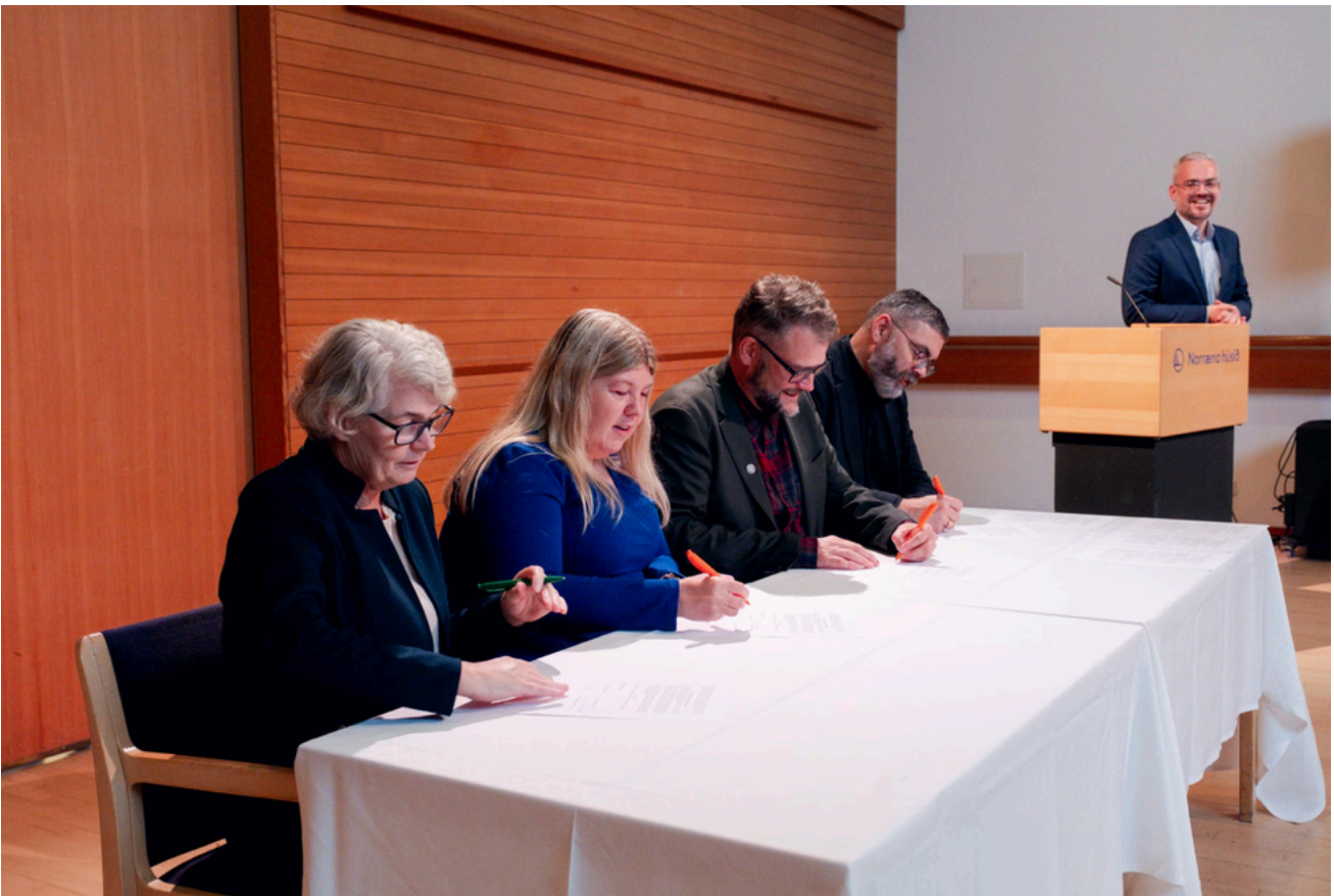
Fulltrúar félaganna skrifuðu undir samninginn við hátíðarlega athöfn í Norræna húsinu

Rekstrargrundvöllur sjóðsins felst í svo kölluðu 0,1% gjaldi sem greitt er af launum ríkisstarfsfólks innan félaganna fjögurra, en því gjaldi er einmitt ætlað að standa straum af kostnaði sem fellur til vegna ýmis konar vinnumarkaðsgreininga.