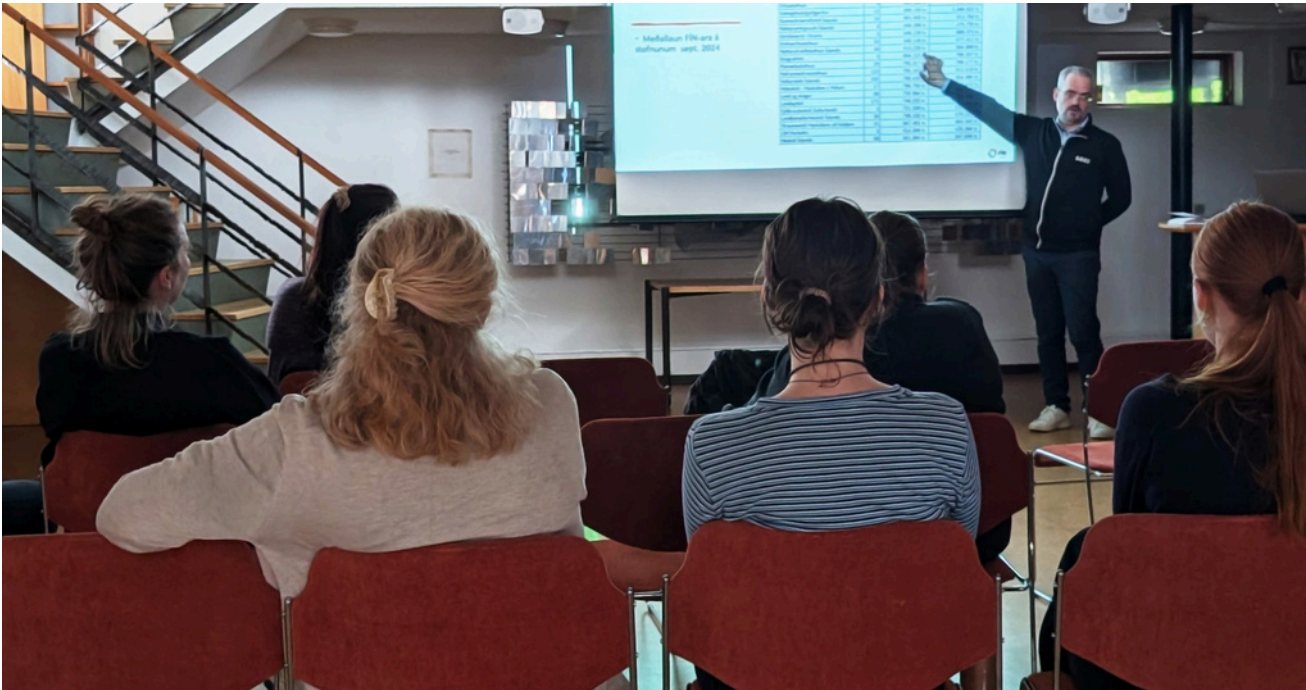
Orri fer yfir stöðuna á Keldum